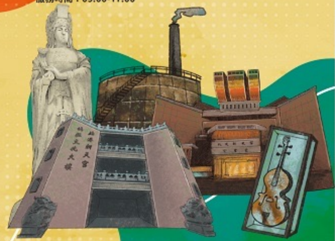
指導單位：Lainvan 配合交通部觀光局安心旅遊國旗補助方案辦理 主辦單位：雲林縣政府